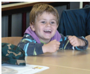
Dit kan zo niet verder!

Met de opperste spoed werd gisteren een vergadering in het secretariaat gehouden.