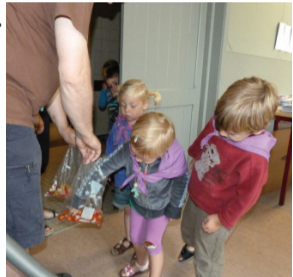
Alex, geef ons een snoepje en we zwijgen erover