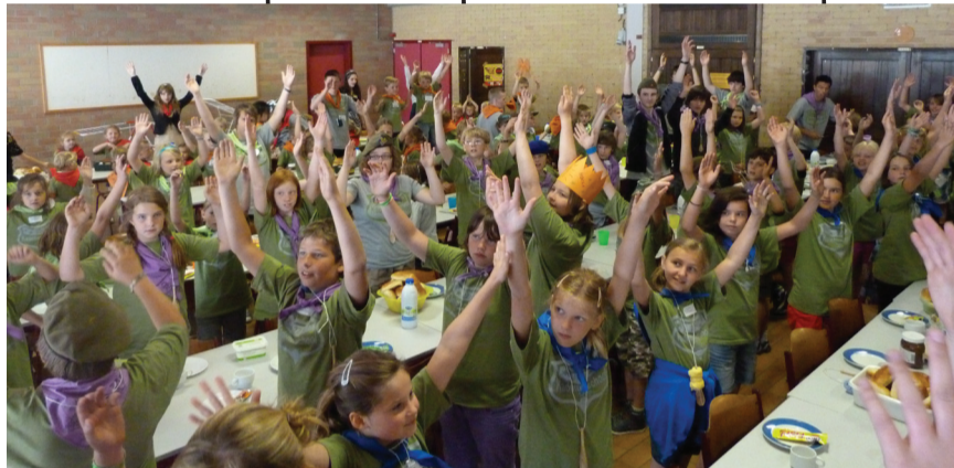
Waar zijn die handjes?!!